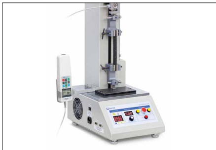
Possibilités de fixation solides et flexibles de nombreux accessoires et pinces de la gamme SAUTER, voir Accessoires