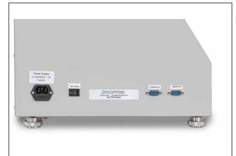
Interface pour le transfert de données du dynamomètre SAUTER FH et pour la commande du banc d'essai avec le logiciel SAUTER AFH