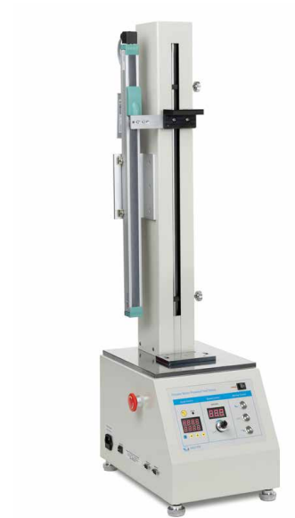
Banc d'essai motorisé incl. appareil de mesure de longueur LD