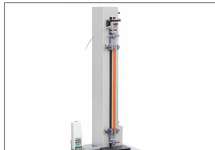
Un grand nombre de possibilités d'utilisation grâce à la course grande